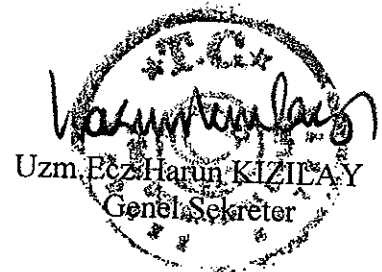
Uzm. Ecz. Harun KIZILAY Genel Sekreter

TS-EN ISO 9001:2008 Belge No: KY-2570-03/10-R